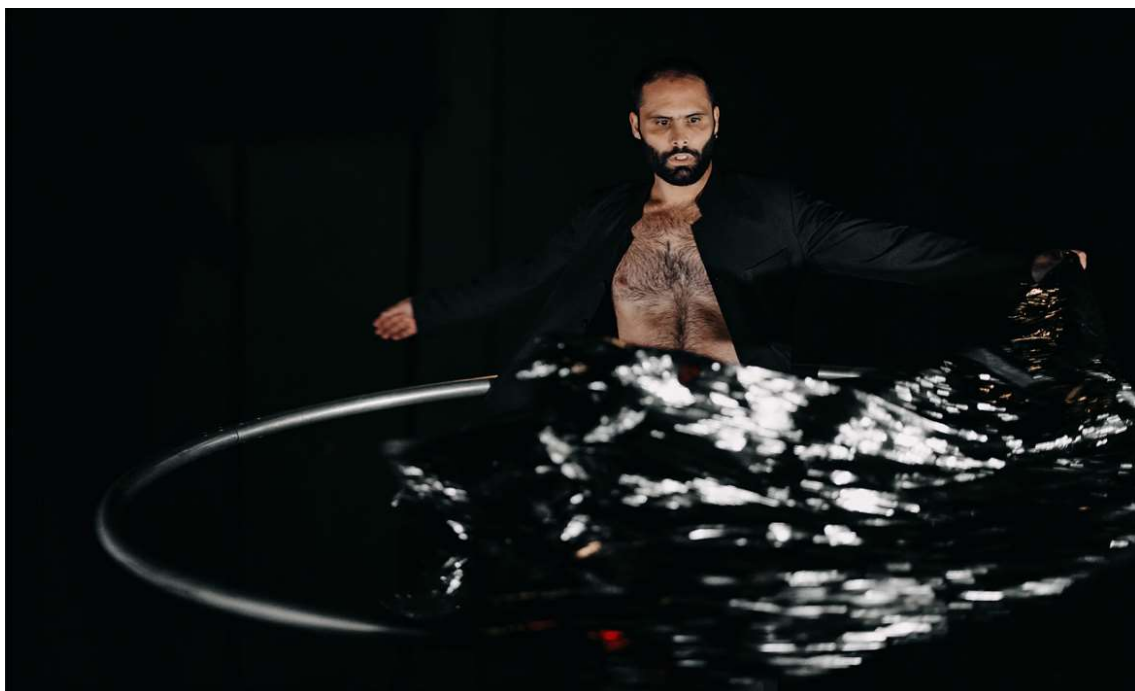
Instante , de Cie. 7Bis